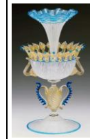
エリーテ・ムラノ工房作 『噴水型フルーツコンポート』