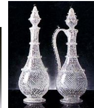
エリーテ・ムラノ工房作 『レティチェッロの水差しとボトル』