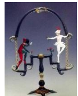
『ロミオとジュリエット』

ブバッコの作品の世界観に欠かすことのできない「人間の身体の美しさ」を極限まで表現したシリーズ『白鳥の湖』と『ロミオとジュリエット』、精神の深層を題材にした幻想的な世界や、ヴェネツィアの伝統行事「カーニバル」など、ガラスとは思えないほどの繊細さ、ヴェネツィアガラスの特長である色彩の豊かさが存分に発揮された、「ルチオ・ブバッコの世界」をどうぞご堪能ください。