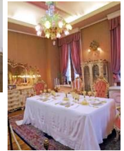
<貴族の食堂> 『天使が微笑むディナーテーブル』