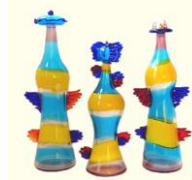
サルビアティ工房作 『DAMA(貴婦人)』

ヴェネツィアガラス一千年の歴史の中で、ガラス作家達は時代と共に様々な作品を生み出してきました。本展では、伝統技法と革新的なデザインを融合させ、優れた技術により制作されたモダンアートガラス作品の数々をご紹介します。 ヴェネツィアガラス界の巨匠アルキメデ・セグーゾやアルフレード・バルビーニ、ピノ・シニョレットの作品をはじめ、VENINI工房やサルビアティ工房など、芸術性の高い作品をご堪能いただけます。