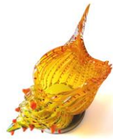
ピノ・シニョレット作 『貝』

アドリア海最深部のラグーナ(潟)の上に築かれたヴェネツィアで生まれ育ったガラス作家達は、ラグーナや海と関わりが深い生活環境の中で幼少期を過ごしてきました。その影響もあり、魚やイルカなど、海に関連した様々な生き物が題材となり、数多くの作品が生み出されています。 本展では、ヴェネツィアをとりまく豊かな自然からインスピレーションを受けた、優れたデザイン性と高度な技術により制作された色鮮やかで美しい作品をご紹介します。