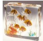
アルフレード・バルビーニ作 『ガラスの中を泳ぐ魚』