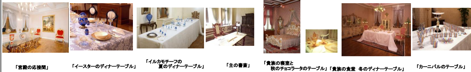
「宮殿の応接間」 「イースターのディナーテーブル」 「イルカモチーフの夏のディナーテーブル」 「主の書斎」 「貴族の寝室と秋のチョコレートテーブル」「貴族の食堂 冬のディナーテーブル」 「カーニバルのテーブル」