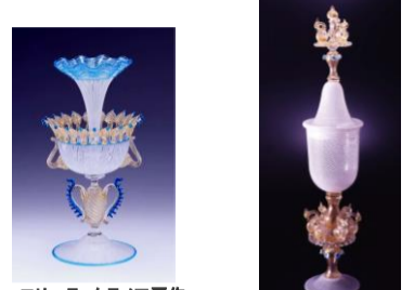
エリーテ・ムラノ工房作「噴水コンポート」 ジュリアーノ・バラリン作「フランチェスカ」

ヴェネツィアガラスの秘法レースガラスの中でも、網目模様の一つ一つに小さな泡が美しいレティチェット技法の作品をはじめとして、複雑な模様作品、レースガラスで演出する華やかで贅沢な貴族の食卓や和食器などを展示致します。