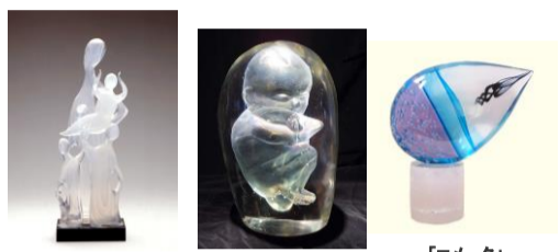
「ファミリア」 「天使」 「コメータ」

伝統的なヴェネツィアガラスの技法を駆使し、斬新なアイデアで作られた作品、現代の空間に似合うアート作品などモダンデザインのヴェネツィアガラスをご紹介します。巨匠ピノ・シニョレットなど、代表的な作家の作品を多数ご覧頂きます。